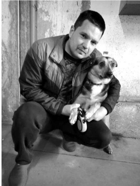
Maksas su sprogimų baimės susargdinta Dikse.

Šis milijoną gyventojų turintis Juodosios jūros miestas yra vadinamas kurortiniu Ukrainos perlu. Didžiulį Rusijos valdovo