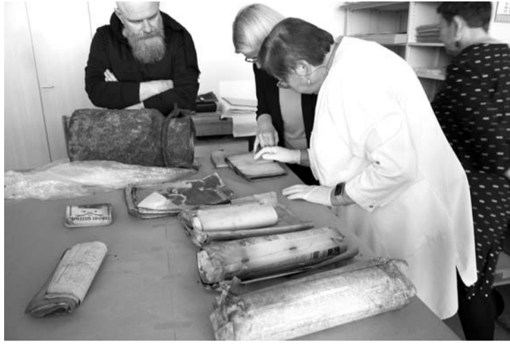
Spėjama, kad bidone rasti dokumentai galėjo priklausyti Algimanto apygardos Šarūno rinkinei.

Atliekant pirminę bidono viduje esančių dokumentų apžiūrą nustatyta, kad jame buvo 6 įvairaus dydžio ir storio dokumentų ritinėliai. Lietuvos centrinio valstybės archyvo restauratoriams pavyko išvynioti kelis geriausiai išsilaikiusius dokumentų ritinėlius. Juose rasti galimai Algimanto apygardos 1947–1950 m. dokumentai: įsakymai, raportai, pranešimai, žinios apie veiklą ūkinių gėrybių apyskaitos ir kt.. Tarp dokumentų taip pat rastas anglų kalbos vadovėlis, išleistas 1948 m., keliolika Lietuvos kariuomenės žurnalo „Karys“ ir Lietuvos šaulių są-